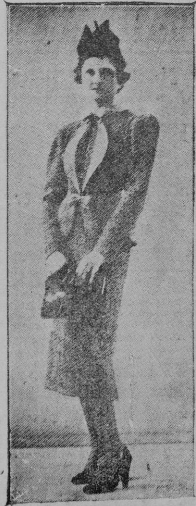
La moda italiana. — Traje de paseo

Pronto el sol y primavera dándose fecundo beso