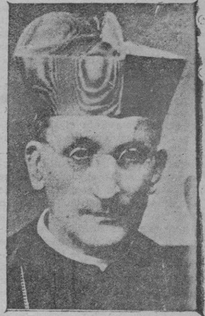
El cardenal Lepicier, que ha fallecido en Roma

etc., y en tanto millares de obreros se debaten en el hambre.