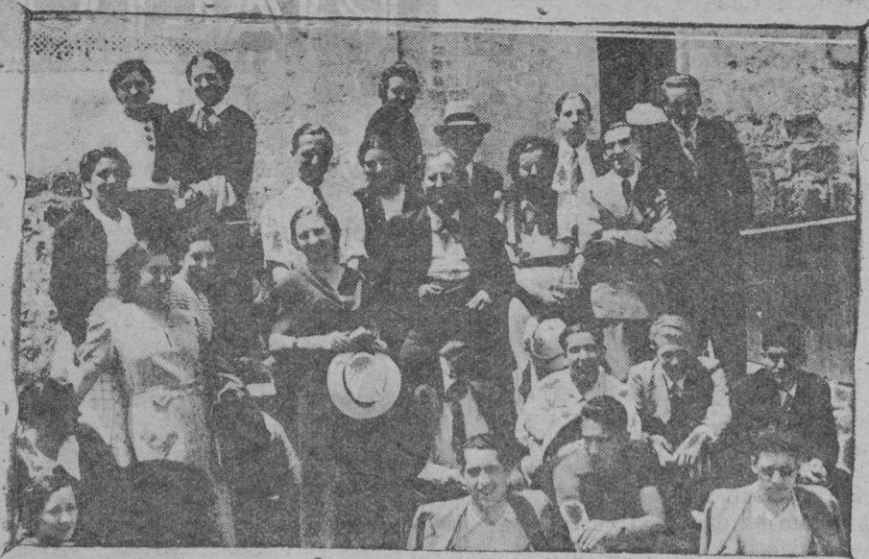
Alumnos y profesores de la Normal de Teruel que en viaje de fin de curso visitan nuestra isla