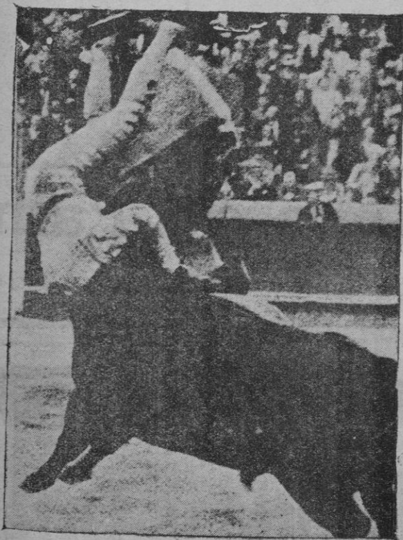
Impresionante momento de la cogida de "Cagancho"