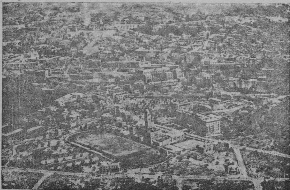
La ciudad de Jerusalén, que intentaron asaltar millares de campesinos árabes con motivo de las luchas que en Palestina sostienen con los judíos