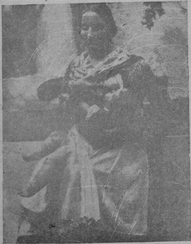
Artística figura de labradora de la falla de la plaza del Mercado, de Valencia, que ha obtenido el primer premio y ha sido indultada del fuego por votación popular