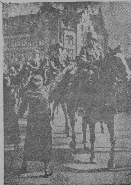
Muchachas de Düsseldorf ofreciendo flores a los soldados alemanes