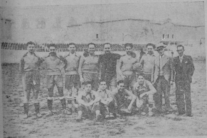
El equipo del Banco Comercial que ganó la copa al equipo del Crédito Balear por 3 a 2

Contra la peste porcina, el suero y virus Pitman Moore; éxito completo. Delegado técnico: B. Caldentey. — Armengol, núm. 1, bis. — Palma.