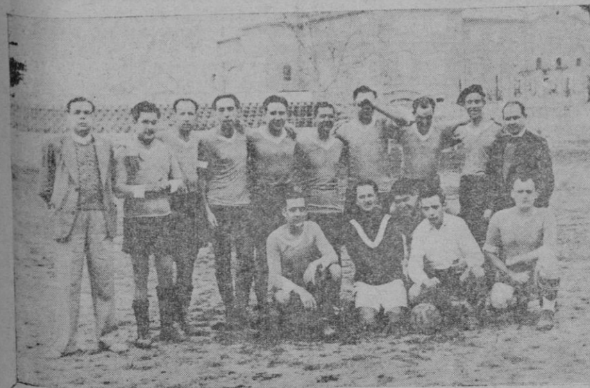
El equipo del Crédito que fué vencido por el del Banco Comercial por 3-2