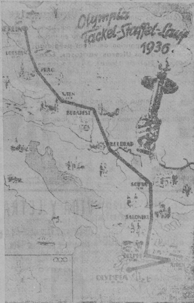
Gráfico del recorrido que harán los atletas portadores del "fuego olímpico", desde Olimpia, donde se celebrará la solemne ceremonia del encendido de las antorchas, que en fantástico río de fuego avanzarán hasta Berlín

Seguidamente, los asistentes solicitaron que les dirigieran la palabra, todas