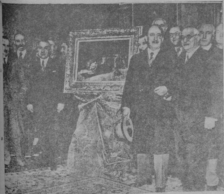
Barcelona. — Entrega por parte de la Asociación de Amigos de los Museos del cuadro de Fortuny "El amateur de estampas", que la citada entidad acaba de adquirir por suscripción popular con destino al Museo de Barcelona. Es un ejemplo digno de imitarse.

Al acto, que será público, quedan invitados todos los socios y cuantas personas gusten asistir.