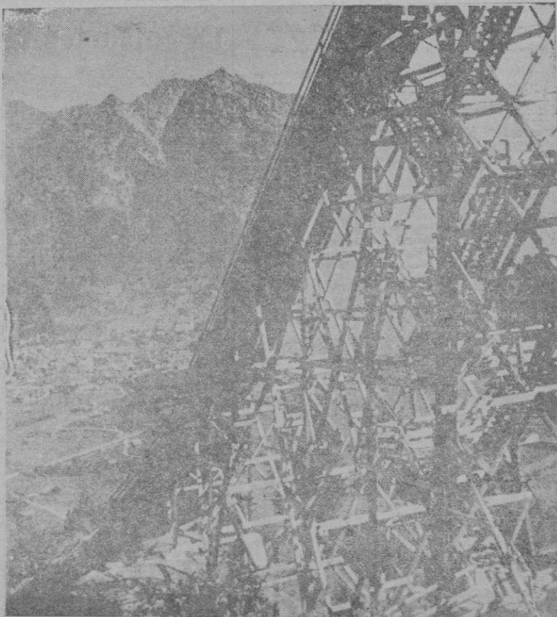
El trampolín olímpico para las pruebas de saltos de esquí