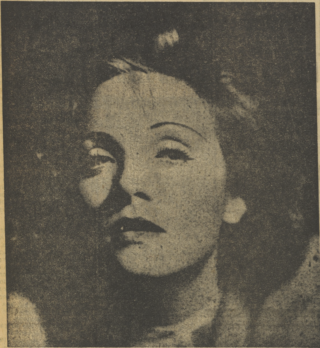
Se dice que Marlene, quien se reveló en la pantalla en la famosa película «El ángel azul», vuelve al cine. Al parecer, interpretará un papel de «vampiro», como el que encarnó con tanto éxito en «Fatalidad», una de las mejores películas de la «estrella» alemana.

MARLENE parece haber descubierto el secreto de la eterna juventud... Eso pueden creer algunos, pero la verdad es que ese secreto no existe o se trata de algo tan simple como la fuerza de voluntad, la disciplina y el buen humor.