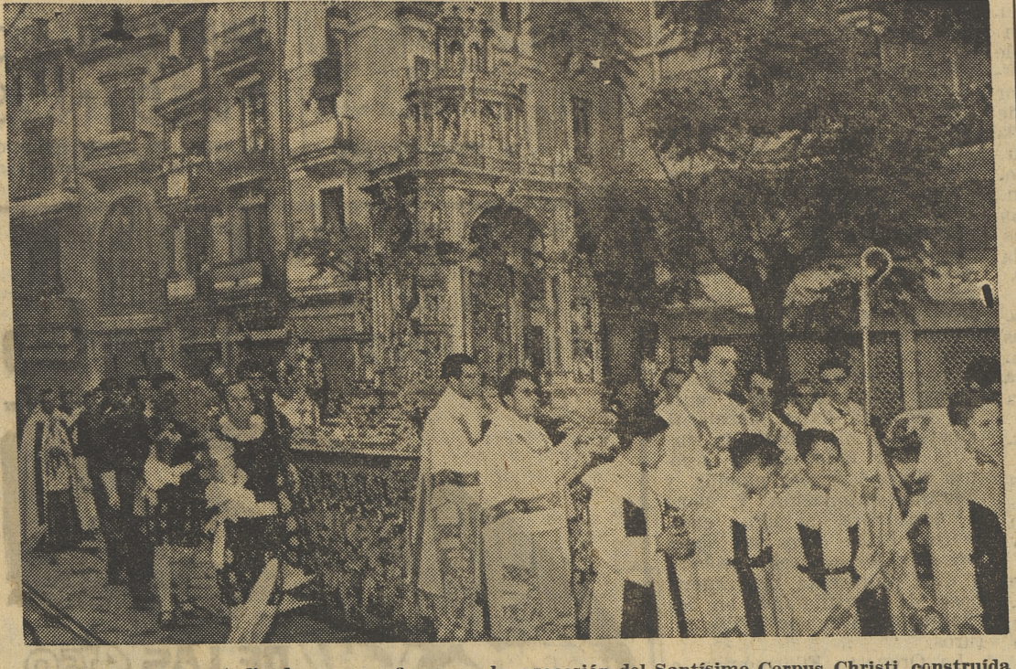
La monumental custodia de oro que figura en la procesión del Santísimo Corpus Christi, construida por aportación piadosa del pueblo valenciano