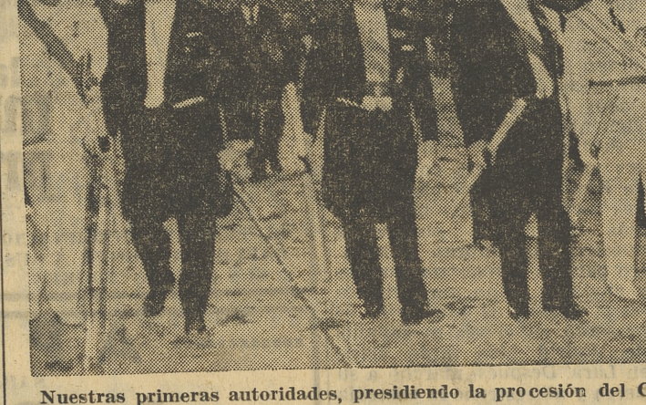
Nuestras primeras autoridades, presidiendo la procesión del Corpus, celebrada en la tarde de ayer

La Delegación Provincial de Invalídidos Civiles (Sección de Lotería), se dispone a celebrar, como en años anteriores, la solemne y tradicional fiesta principal en honor a su Patrona la Virgen de los Desamparados.