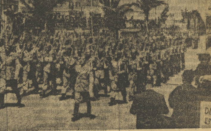
CEUTA. — Presidido por el teniente general Gota Iredona, general jefe del Ejército del Norte de España, se ha celebrado en esta ciudad el Desfile de la Victoria. En la foto, el marchoso paso de bandera de la Legión, ante la tribuna presidencial.