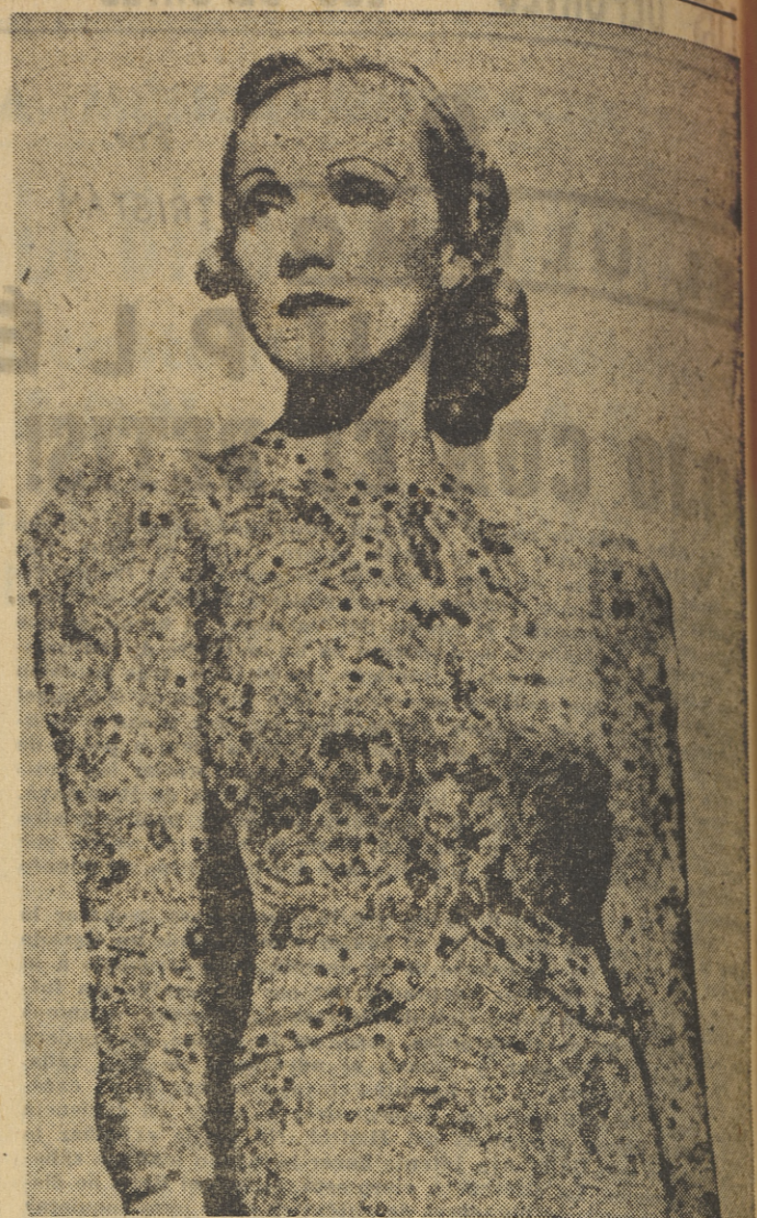
Los años no pasan para Marlene Dietrich. Difunde que conoce el secreto de la eterna juventud. La actriz alemana se distingue todavía por su bellísima silueta y por su elegancia personal.

Le ha sido ofrecido un sensacional contrato para hacer el papel de «mujer fatal» en una nueva película