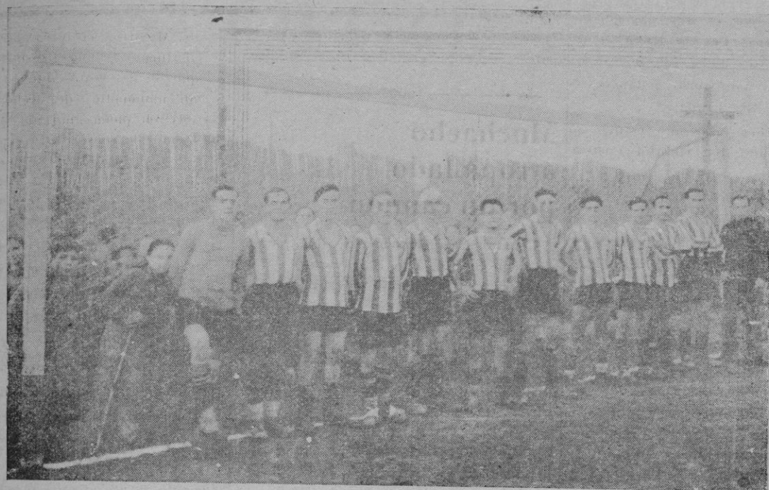
C. D. Artá, tercero en el torneo centro Levantino