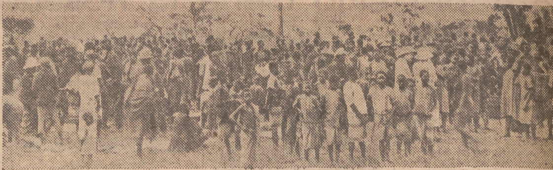
Indígenas del Congo, el principal país suministrador del mundo de uranio

En efecto; los intereses británicos, belgas y australianos, son idénticos en esta materia. Estas tres naciones son, igualmente, pobres en recursos hidroeléctricos. Sus centrales funcionan, en su mayoría, por medio de carbón, y sus yacimientos de carbón son cada