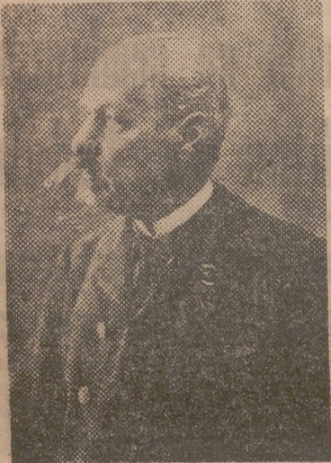
Don Salvador Giner

El concierto de ayer en el teatro Serrano que, patrocinado por la Diputación, conmemoraba el XLII aniversario de la muerte del maestro don Salvador Giner, no merece otra cosa que alabanzas. La Orquesta Sinfónica, todos los años, por este mes de noviembre, recuerda al compositor valenciano. Su nuevo director titular, en el primero de sus conciertos, le ha rendido el anual y debido homenaje. El programa de esta audición, ya