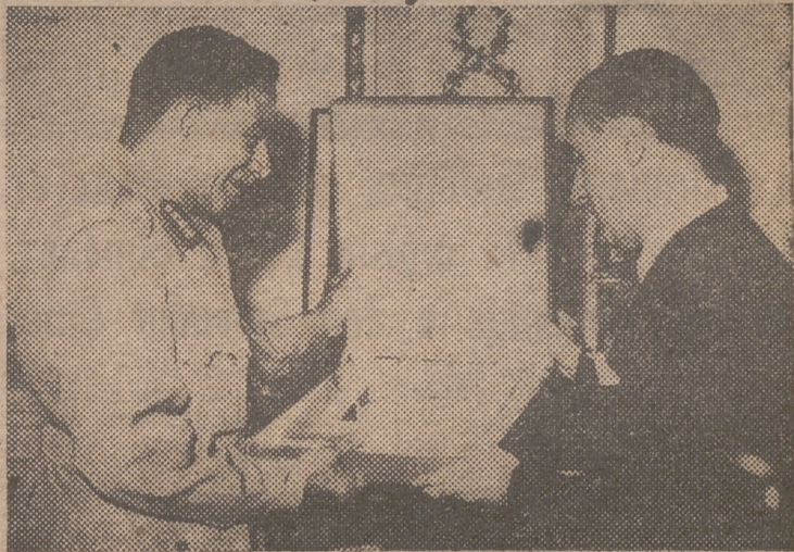
EL CAIRO.—El presidente de la República egipcia, general Naguib, recibe de manos del embajador de España, marqués de Santa Cruz, un retrato del generalísimo Franco con dedicatoria autógrafa del Jefe del Estado español.