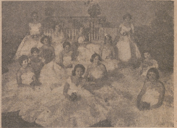
Estas jóvenes, fotografiadas antes de un baile de gala, son las hijas de los hombres más ricos del Brasil. Sus padres son lo que han creado el museo de San Pablo