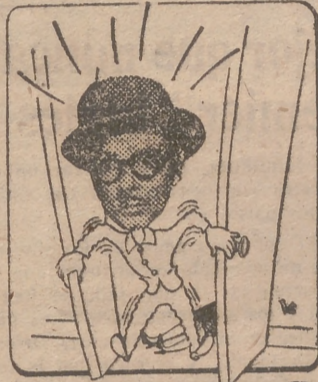
ARTHUR EARHARTON (GEORGE BRENT)

En una noche fatal, el pobrecito apocado, se imagina criminal por sentirse enamorado.