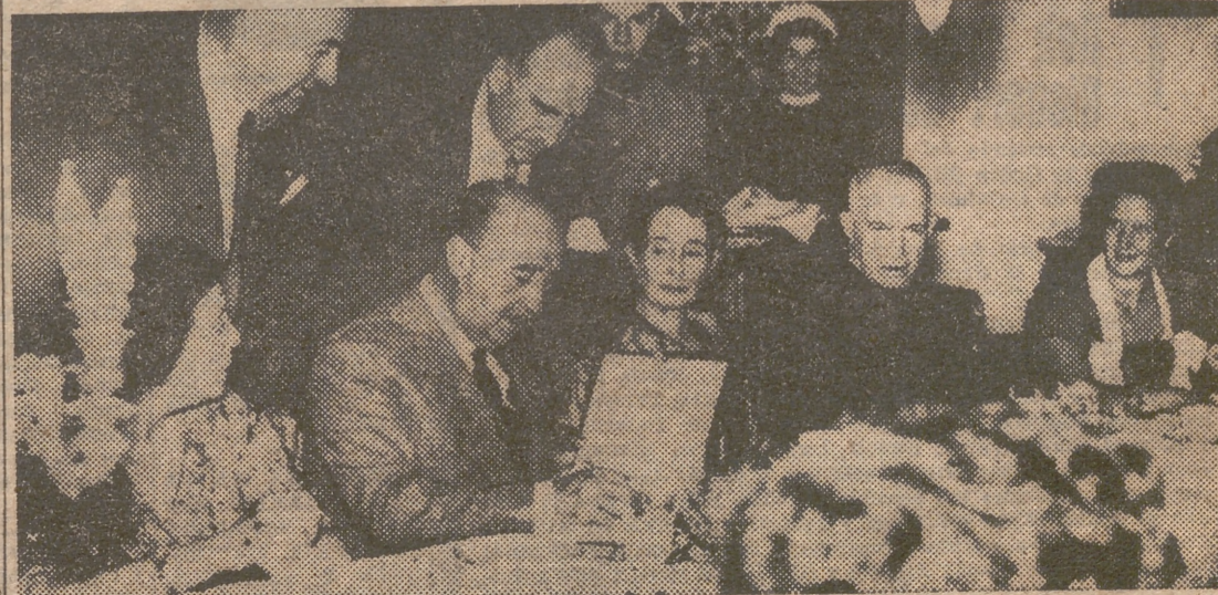
SANTIAGO DE COMPOSTELA. — S. E. el Jefe del Estado, en el momento de estampar su firma en el álbum del Pazo del Paramello, durante su visita a dicha finca, acompañado de su esposa y diversas personalidades.