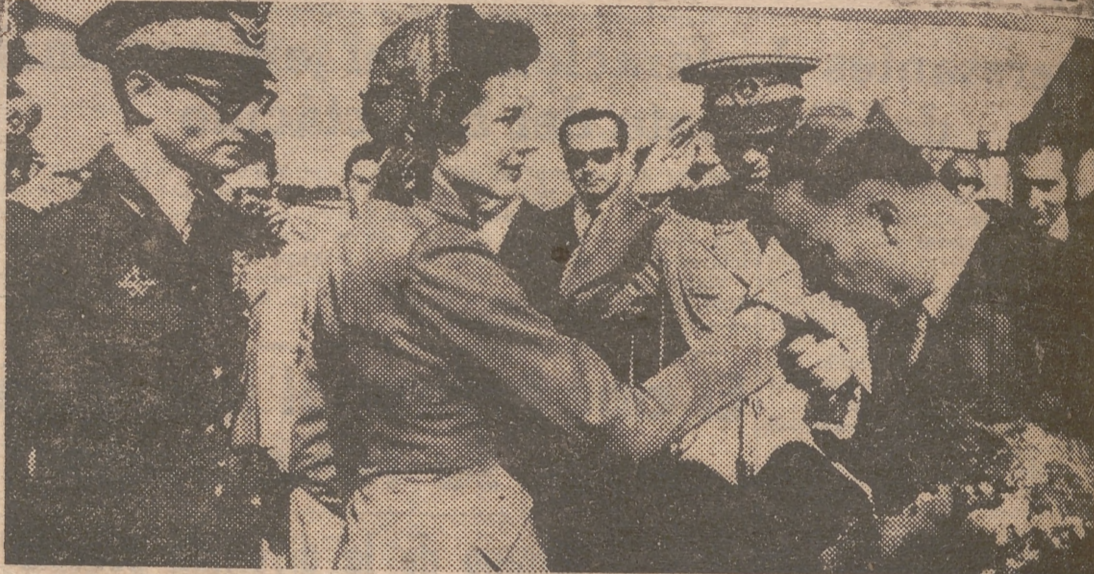
TEHERAN. — Procedente de Roma llegó al aeropuerto de esta capital, la bella Soraya, para reunirse con su esposo, el sha, y con su pueblo, que le aclamó y vitoreó entusiastamente. El primer ministro, Zahedi, aparece en la foto besándole la mano, como bienvenida oficial. Detrás de la reina, aparece su esposo, rodeado de altos oficiales del Ejército y miembros del Gabinete iraní.