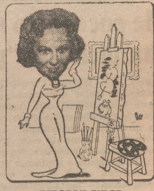
DEBORAH TYLER (VIRGINIA MAYO)

En una noche fatal, el pobrecito apocado, se imagina criminal por sentirse enamorado.