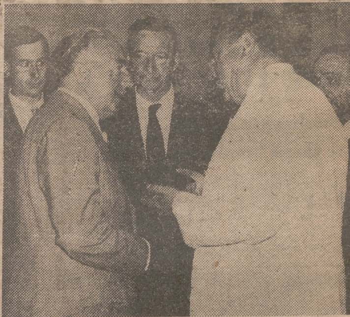
SAN SEBASTIAN. — El primer ministro de Irlanda, De Valera, y el ministro de Asuntos Exteriores de España, don Alberto Martín Artajo, durante la entrevista que sostuvieron en compañía del embajador de dicho país y otras personalidades. Se examinaron algunos aspectos de las relaciones que unen a España e Irlanda, a la luz de los ideales comunes que mueven a ambas naciones.