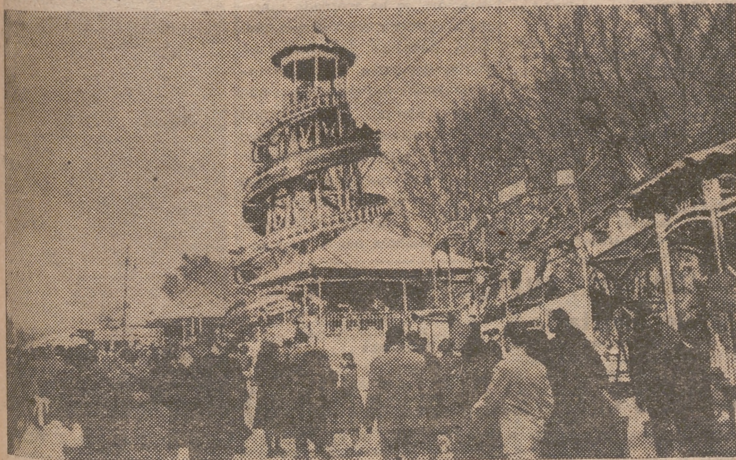
Un aspecto de la feria valenciana de Navidad, que ahora se reproduce en la feria granadina