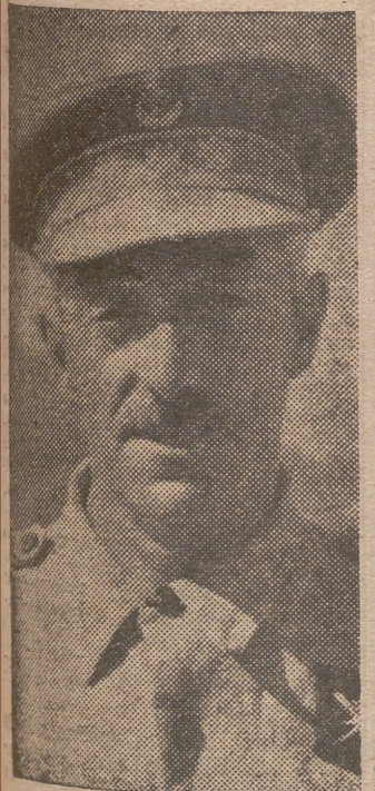
MADRID, 16 — VICTIMA DE CRUEL DOLENCIA, HA FALLECIDO ESTA MAÑANA EN MADRID, EL TENIENTE GENERAL BARRÓN.—Cifra.

LOS GRANDES REPORTAJES DE JORNADA MAÑANA: LA HERENCIA MAS DISPUTADA DEL SIGLO Miguel de Rumania, Carol Lambrino y la señora Lupescu, enfrentados El fallecido ex monarca rumano, poseía grandes cuentas bancarias en Estados Unidos, inmensas propiedades en Méjico y Brasil, importantes cantidades de oro en los bancos suizos y su residencia de Estoril está repleta de tesoros artísticos