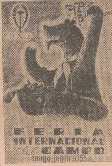
Uno de los carteles anunciadores de la Feria Internacional del Campo

Washington, 10. — El teniente general Charles E. Bolte, actualmente comandante del VII ejército, se hará cargo en el próximo mes de marzo del mando de todas las fuerzas norteamericanas en Europa. Bolte sustituirá en tal puesto al teniente general Manton S. Eddy, quien se retirará el día 31 de marzo próximo, después de haber prestado más de 35 años de servicio en el ejército. —Efe.