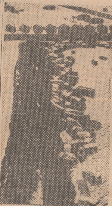
Un campo de aparcamiento de autobuses, inundado por las aguas, que derribaron los vehículos

el grado de adelanto material de un país por las vías de comunicación que tenga al servicio de la producción. Cuando a un país le faltan vías de comunicación expeditas, es imposible que se des-