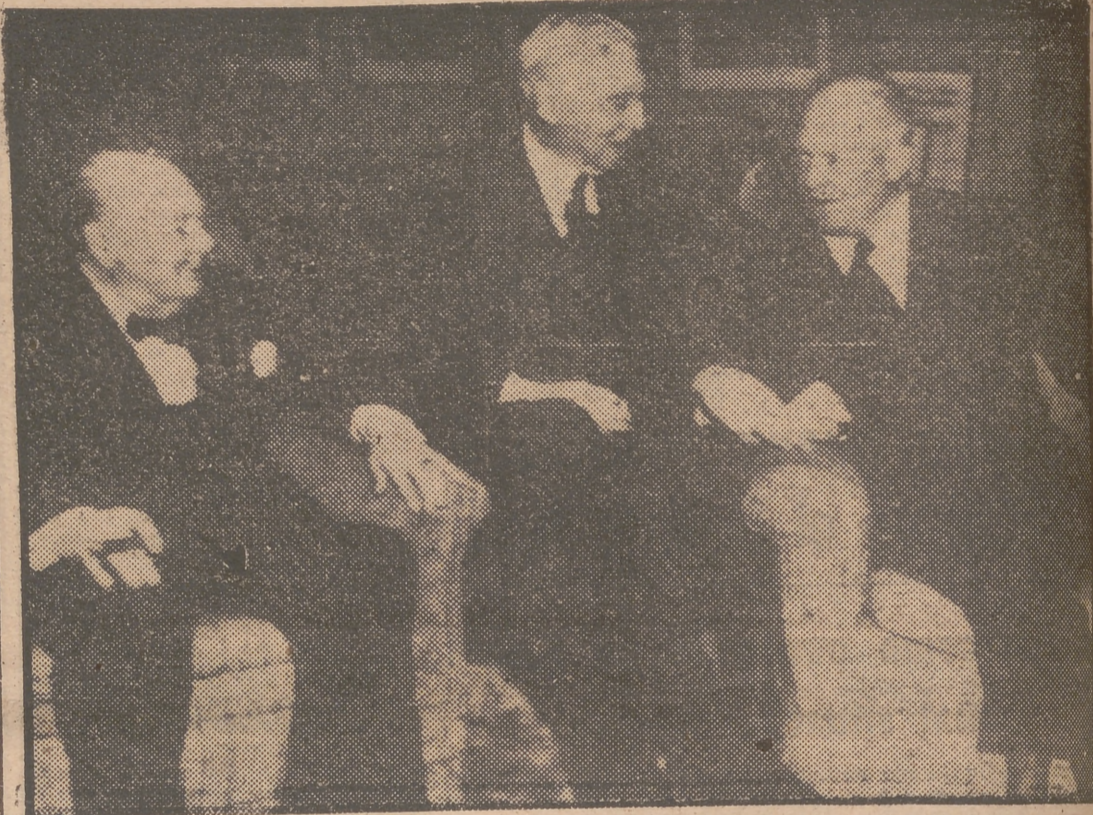
Eisenhower y Churchill, en casa de Baruch

disputas y hablen claramente y sobre Inglaterra, para que se decida a apoyar la cooperación con el Continente en lugar de obstaculizarla. Unidos. Tanto más, cuanto que