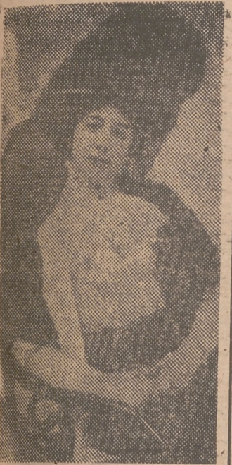
La Otero, ataviada con la elegancia natural de su época

Coincidiendo con estas fechas que ahora desaparecen del calendario para dar paso a otras nuevas, hemos recogido algunos de esos episodios acaecidos hace muchos años, lo que no impide que algu-