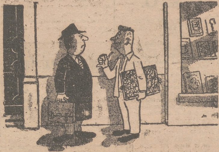
—Estoy seguro, maestro, que su libro alcanzará un gran éxito; la portada está muy bien dibujada.

Merece ensalzar la actitud de los vecinos del pueblo de Domeño, que se aprestaron a auxiliar a los accidentados, colaborando con el Juzgado de Instrucción de Chelva, autoridades y Guardia civil.