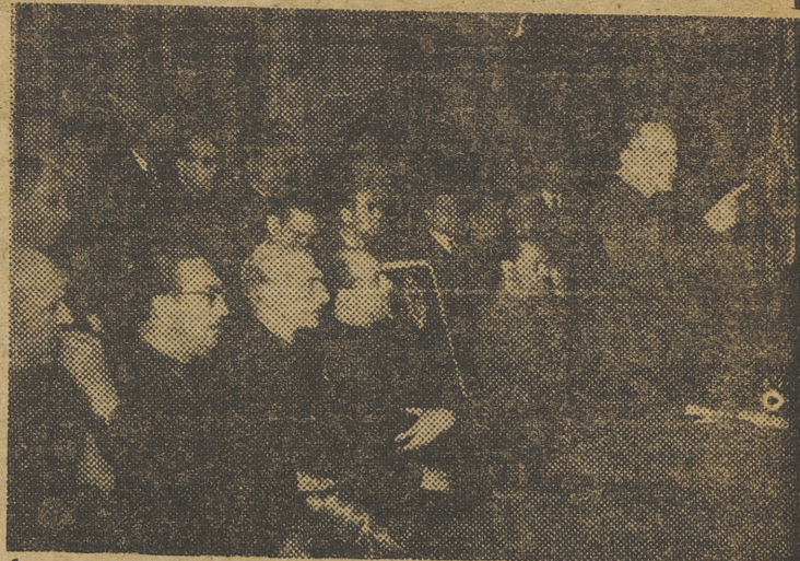
El ministro secretario General del Movimiento, señor Fernández Cuesta, durante el discurso que pronunció en el acto de proclamación de candidatos sindicales a procuradores en Cortes.