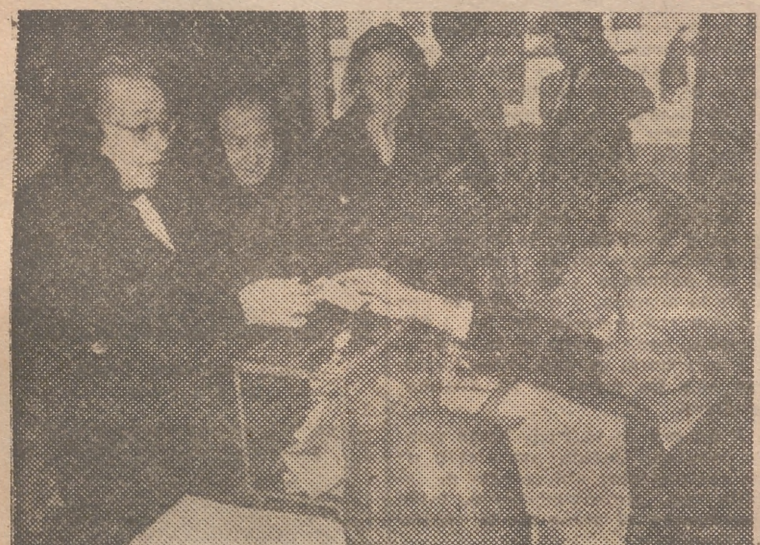
Una señora ante la urna

provincial y gobernador civil, don Diego Salas Pombo, votó a las 9:30 de la mañana en el colegio situado en la plaza de San Bult, número 1, sección 46; el presidente de la Diputación, don Francisco Cerdá Reiz, a las 13:20, en la calle de la Paz, 11, sección 53; delegado de Hacienda, don Miguel Lozano, en la plaza de San Bult, número 1, sección 46; alcalde de la ciudad, don Baltasar Rull Villar, a las 13:25, en la calle del Conde de Salvatierra de Alava, 14, sección 28; jefe de la Tercera Región Aérea, general Sáenz de Buruaga, a las 13:40, en la calle del Pintor