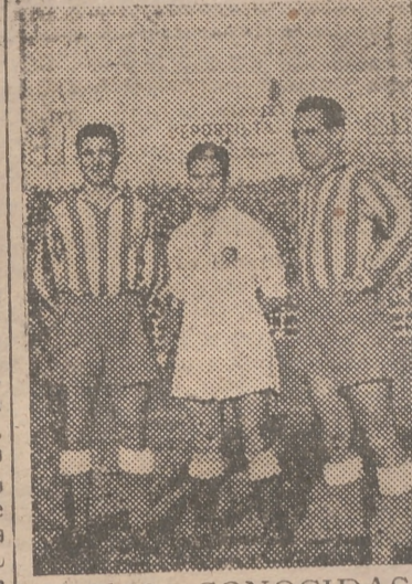
CARAS CONOCIDAS EN ALCOY

tes al choque con el Español no permitían ni soñar. Una hazaña que al propio Nogués ha hecho decir: "Si el Valencia juega siempre así, llegará muy lejos".