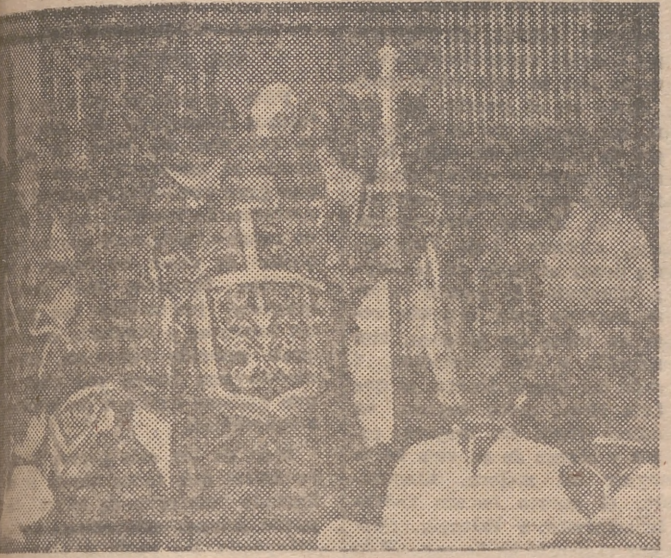
El señor arzobispo inicia los actos del Sinodo diocesano momentos antes de comenzar la Misa de Pontifical en la Catedral

tán estudiando estos días los proyectos de constituciones y enmiendas presentadas a ellas, que deberán terminarse para el próximo día