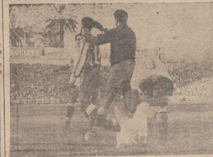
GOL Y CONTENTO