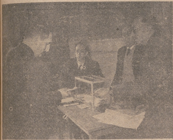
El gobernador civil, en el momento de depositar su voto