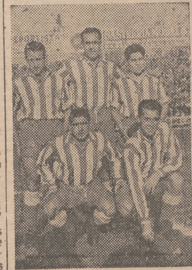
DELANTERA EN BAJA