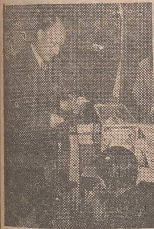
He aquí un voto de calidad: el alcalde, eligiendo sus colaboradores

El Valencia se anotó ayer un triunfo sensacional, que le ha valido situarse en primer lugar de la clasificación de la Liga. Contra todo pronóstico de la cátedra, venció al Español por 3-2, en el campo de Sarriá. He aquí el momento en que Badenes, en espléndida jugada, batía a Trias y marcaba el tercer tanto valencianista, que reafirmaba una victoria que desde mucho antes se veía venir. (AMPLIA INFORMACION LITERARIA Y GRAFICA DEL ENCUENTRO EN NUESTRAS PAGINAS DEPORTIVAS.)