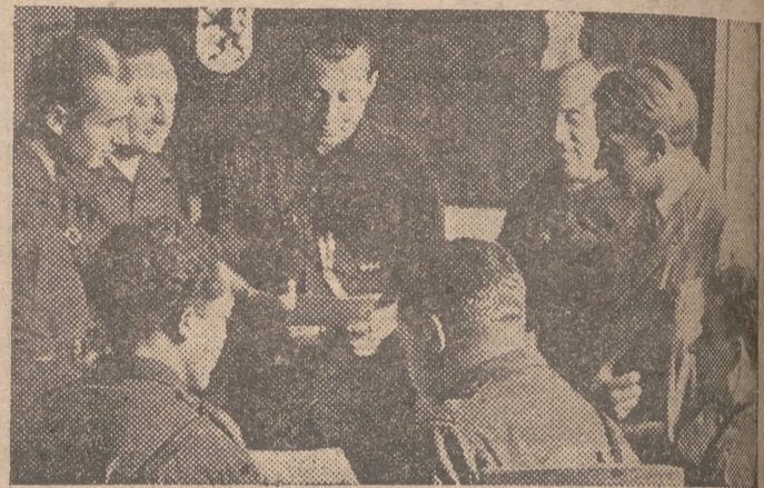
José Antonio presidiendo una reunión del Consejo Nacional

Frente a un mundo de podredumbre se alzó la voz recia del Fundador de la Falange, proponiendo un nuevo orden, formado por elementos psicológicos y técnicos también nuevos. José Antonio no se limitó a combatir negativamente las ideas viejas y fracasadas del capitalismo y las ideas materialistas y nuevas del marxismo, sino que, frente a ese mundo ausente de valores espirituales, opuso una concepción nueva, basada en la personalidad y dignidad del hombre. Y ese pensamiento, auténticamente español creación de nues-