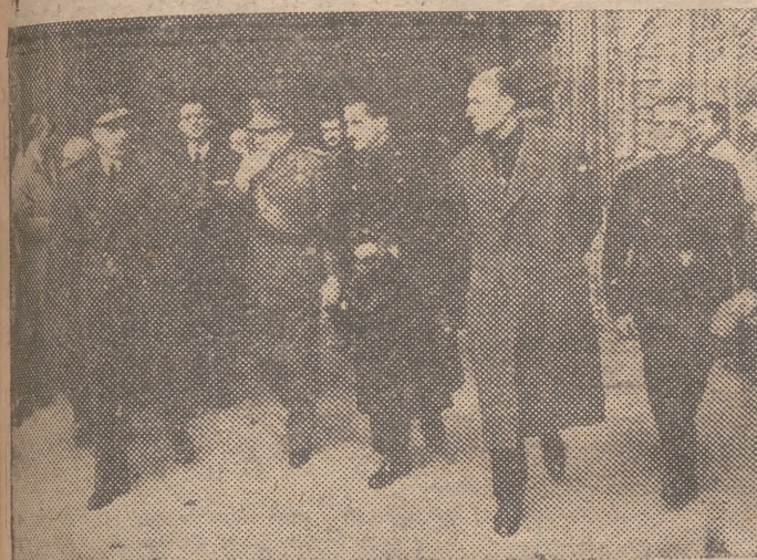
Esta mañana, con motivo del aniversario de la muerte de José Antonio, se ha celebrado en la Catedral un solemne funeral en sufragio del alma del fundador de la Falange. En la foto, las autoridades y jerarquías, a la salida del templo. (Información en tercera página.)