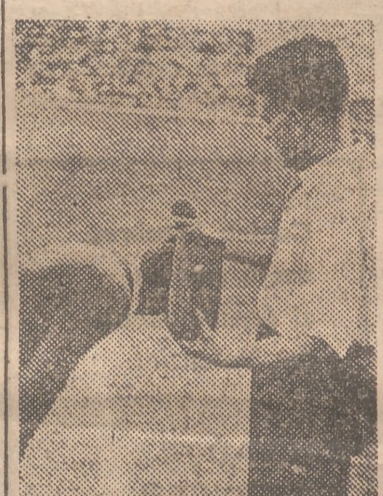
En muchos casos, el "agua milagrosa" recupera inmediatamente al presunto lesionado. En otras, bastantes también por desgracia, tiene que intervenir el médico

nociamos. Quede aparte la conmoción que se produjo en el choque con Suñer y de la que ya es restablecido. El pundonoroso medio resultó, además, con una herida contusa en el tercio medio de la pierna izquierda, de una profundidad y longitud como un dedo meñique. Tal herida, que indudablemente se la produjo un contrario en un puntapié, debió ser producida por el clavo de un taco al desprenderse éste de alguna bota. Solamente así se explica el que la media y el vendaje fueron rasgados materialmente y se produjera la herida ocasionada con objeto cortante. Ustedes recordarán que el domingo Trapote, en cierto