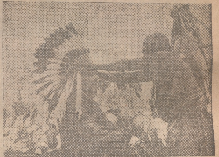
El mariscal vizconde Alexander, gobernador general del Canadá, recibe, de manos de los bravos indios canadienses, el tocado de plumas de jefe y el título de Pit-Ko-Kom, que significa Cabeza de Aguila.