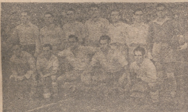
El U. D. Las Palmas, próximo rival del Valencia

Por de pronto, hay que reconocerles al A. de Madrid y Valencia una privilegiada posición con la mirada puesta en la clasificación y en sus rivales del próximo domingo. Los dos se desplazan de la península: el primero a Tetuán y el segundo a Las Palmas. El ambiente, los es