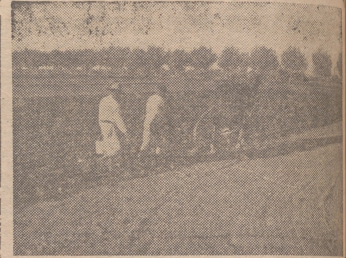
Siembra del trigo a "chorrillo"

planta, lo cierto es que su cultura data de época muy remota, habiéndose enumerar entre los primeros que emprendiera el hombre desde que se inició en el arte de cultivar la tierra. Por tanto, ya en tiempos antiquísimos el trigo se cultivaba en una zona inmensa-