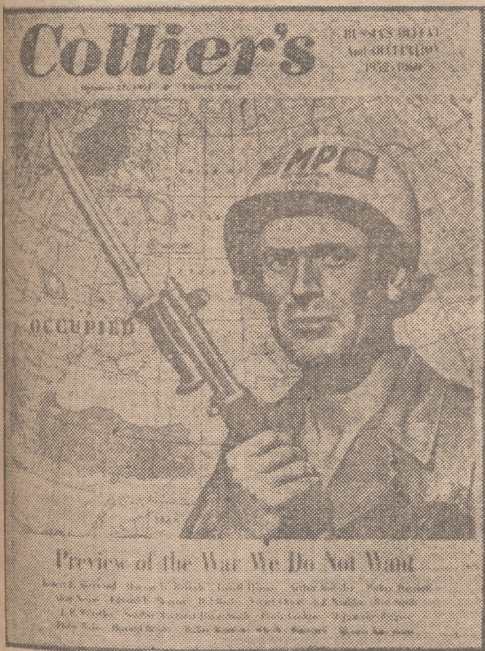
La portada de "Collier's"