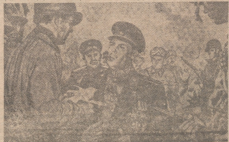
El hijo de Stalin cae prisionero de los aliados al volar sobre el Sarre

desde submarinos; pero la aviación norteamericana afirma su superioridad, y el 22 de julio, en represalia de un raid de terror sobre Washington, Moscú queda destruido: un comando de paracaidistas opera en los Urales, destruyendo los depósitos de bombas atómicas de los rusos, mientras que se desarrollan guerrillas interiores en las líneas rusas. En 1954, Stalin ha desaparecido y es reemplazado por Beria, jefe de la policía se-