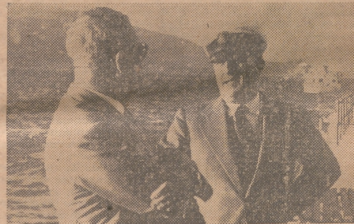
Franco conversa con el ex ministro de Industria y Comercio señor Suanzes, antes de embarcar en el "Azor".