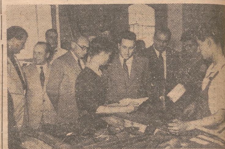
Visita a la Escuela de Trabajo.