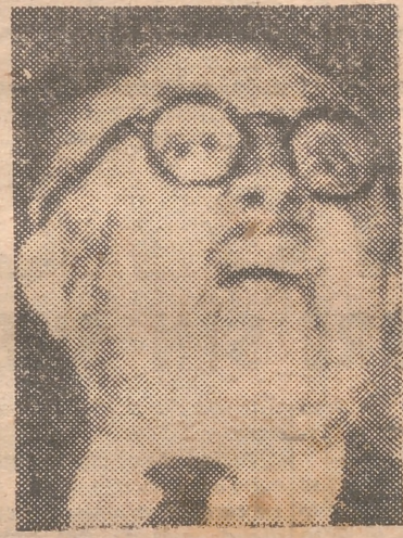
DU CLOS La máscara de la muerte roja