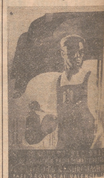
Cartel del V Concurso Nacional Formación Profesional

Las pruebas de examen que efectúan estos 350 aprendices durante