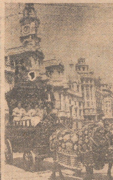
Una de las «rocas» que figuraban en la cabalgata