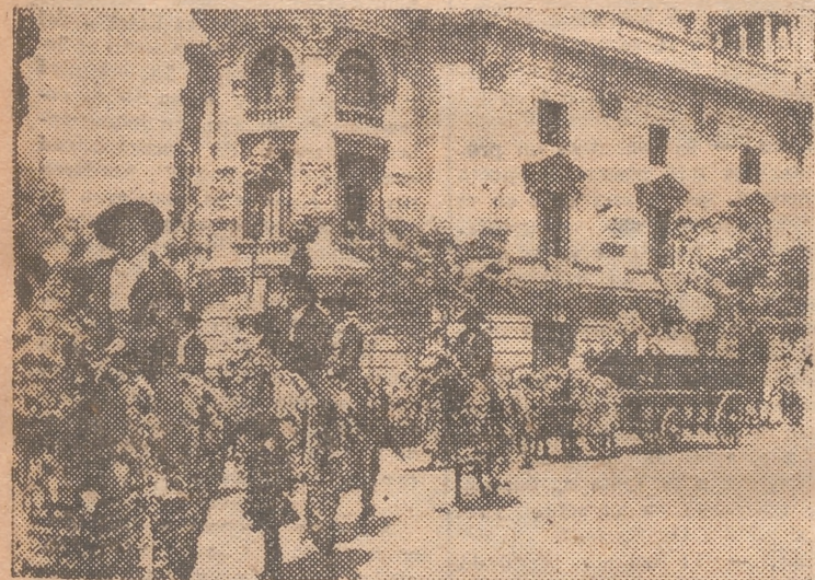
Esta mañana, como ya es tradicional, ha recorrido las calles de Valencia la cabalgata anunciadora de las fiestas del Corpus. En la foto, un aspecto del brillante cortejo a su paso por la plaza del Caudillo