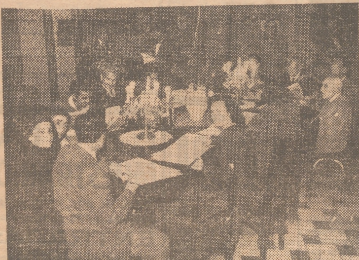
Visitantes y lectores de las carpetas de la IV "Taula de Poesía". — (Fotos Finezas).