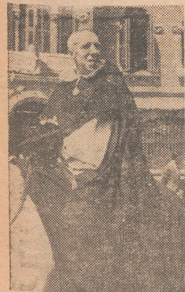
El capellán de «Ces roques», que presidia la comitiva