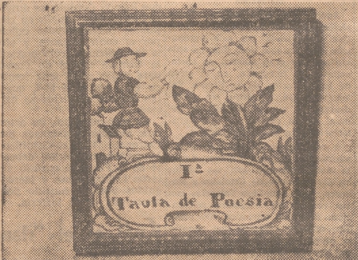
Un azulejo de Mateu, conmemorando la I taula