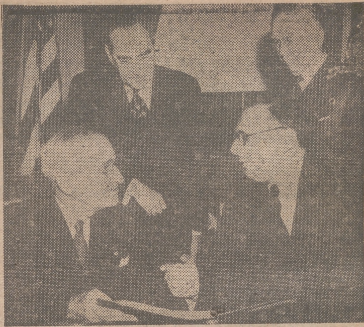
WASHINGTON. — El presidente Truman y el primer ministro francés René Plevén, en una de las conferencias celebradas en la capital de los Estados Unidos para abordar los acontecimientos suscitados por las agresiones comunistas. Intervienen en las conversaciones Acheson (izquierda) y Marshall.