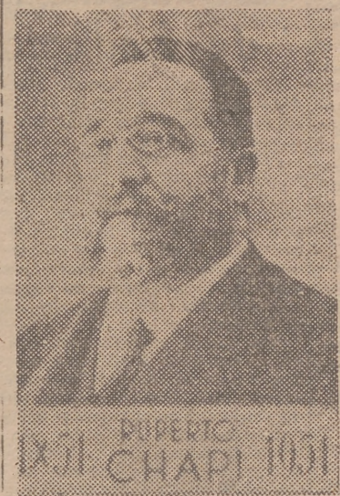
Uno de los sellos conmemorativos del primer centenario de Chapi

La prensa y las emisoras nacionales vienen haciéndose eco y altavoz de los trabajos preparatorios que se están llevando a cabo en la ciudad de Villena, por la comisión organizadora de los festejos conmemorativos del centenario de don Ruperto Chapi.