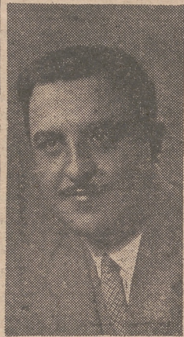
por completo, poniendo al servicio de los intereses sindicales de la pro-