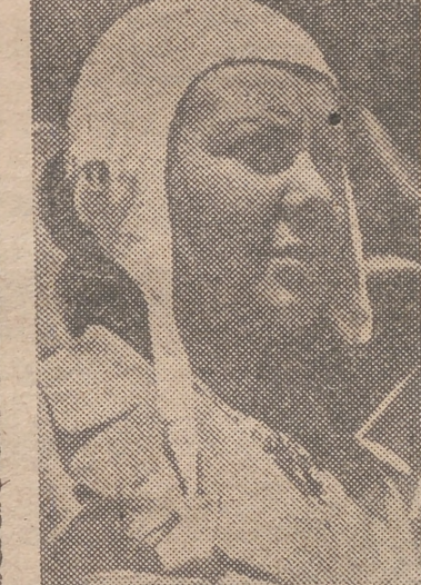
Sabiha Gökçen Recuerdos de Salgari

A las pocas semanas de haber abandonado Seúl, casi sin lucha, las fuerzas de la O. N. U., en su ofensiva de "objetivos limitados", están otra vez a las puertas de la capital de Corea del Sur. Sobre la retirada norteamericana se han escrito muchas y acerbas críticas, diciendo que el alto mando se dejó ofuscar por "el peligro amarillo" y que sin atender a la verdadera proporción de fuerzas, se hacían retiradas de muchos kilómetros en cuanto aparecía una patrulla china. Esto, con gran asombro de las fuerzas propias, especialmente, de los turcos, que después de vencer a la bayoneta a sus adversarios, no comprendían el motivo de la retirada. Por cierto, que haciendo honor a sus tradiciones guerreras, ahora ha ido a Corea la hija adoptiva de Kemal Atatürk, Sabiha Gökçen, que es piloto de la aviación militar turca. Acción que nos trae a la memoria las lecturas de nuestra infancia: un «Lón de Damasco» que, adaptándose al progreso, haya sustituido la cimarra por el avión.