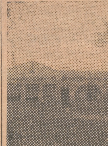
Aspecto general de la magnífica Guardería Infantil del Sindicato Nacional de Frutos y Productos Horticolas, de Alcira