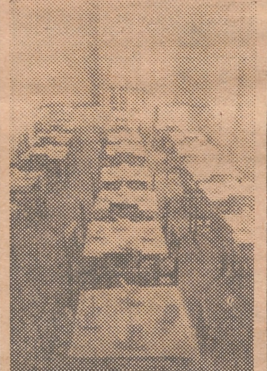
Magnífico comedor de la Guardería Infantil que el Sindicato Nacional de Frutos ha creado en la ciudad de Gandía, donde serán atendidos los hijos de las productoras naranjeras encuadradas en dicho Sindicato

Lo que se hace público para conocimiento de los señores alcaldes delegados locales de Abastecimientos y Transportes, a los efectos oportunos.