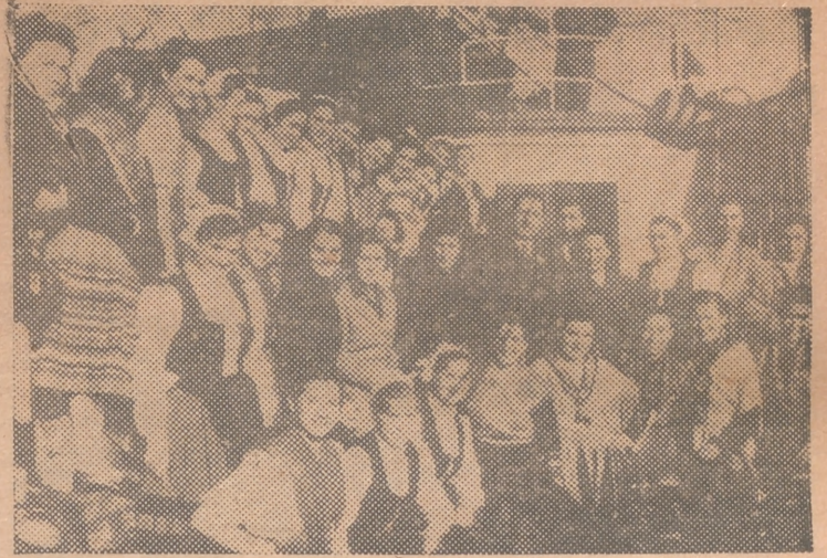
BARCELONA.—Las muchachas de los Coros y Danzas de la Sección Femenina, que han realizado una triunfal gira artística por tierras de Egipto y Oriente Medio, fotografiadas junto a la delegada nacional, Pilar Primo de Rivera y gobernador civil de Barcelona, que acudieron a recibir las.