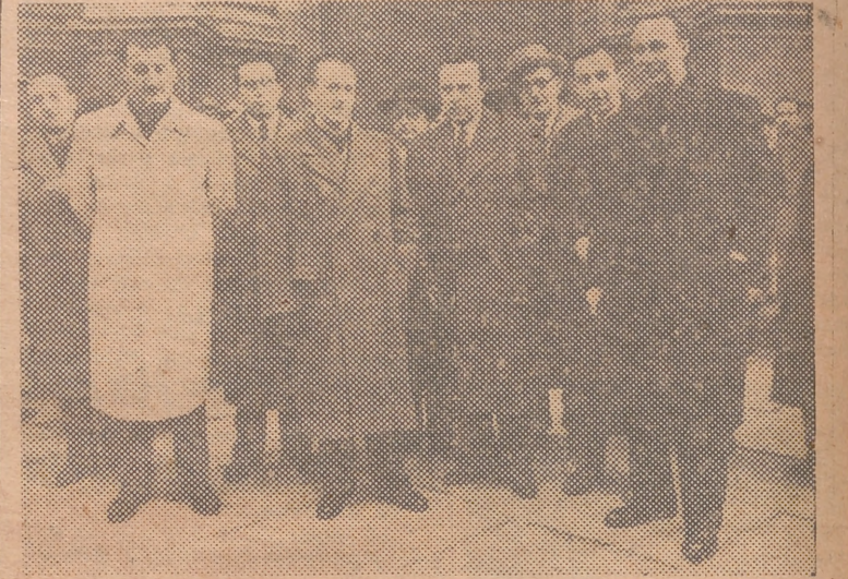
Las autoridades en la puerta de la Catedral, a la salida de la misa celebrada esta mañana

Después de este acto inaugural, se organizó el viaje a la ciudad de Gandía, pasando por Tabernes de Valldigna, a través de aquella zona naranjera.