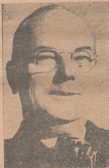
SYNDER, SECRETARIO DEL TESORO La movilización empieza en su Departamento

Los gastos militares, 41.421 millones de dólares, doble que el año pasado, están destinados a convertir a los Estados Unidos y sus aliados en la mayor potencia militar del mundo. Se trata, por lo pronto, de crear, lo antes posible, un ejército de tres millones y medio de hombres en Norteamérica. Todo esto se ha de hacer a fuerza