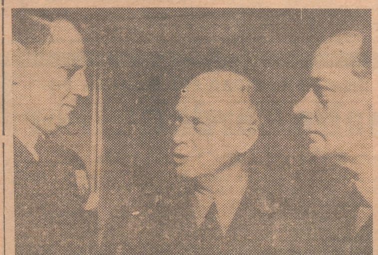
COPENHAGUE.—El general Eisenhower, comandante supremo de las fuerzas del Pacto del Atlántico (centro), fotografiado con el rey Federico de Dinamarca (izquierda) y el almirante Quistgaard.

Londres, 16.—El mariscal Montgomery se ha reunido esta mañana con el general Eisenhower para celebrar conversaciones con el comandante en jefe de las fuerzas atlánticas.—Efe.