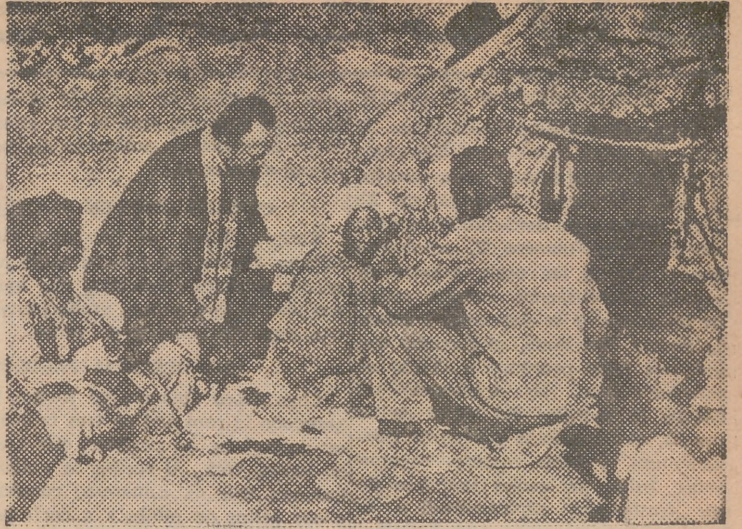
Un misionero de San Francisco de Sales, del Vicariato Apostólico del Rio Orange, administrando los últimos sacramentos a una pobre mujer... La vida es siempre precaria en el "veld" del Sud Africano, pero en estos años últimos una sequía extrema ha contribuido a hacer aún más desgraciados a aquellos pobr indígenas...