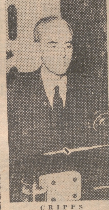
CRIPPS El laborismo padece del estómago