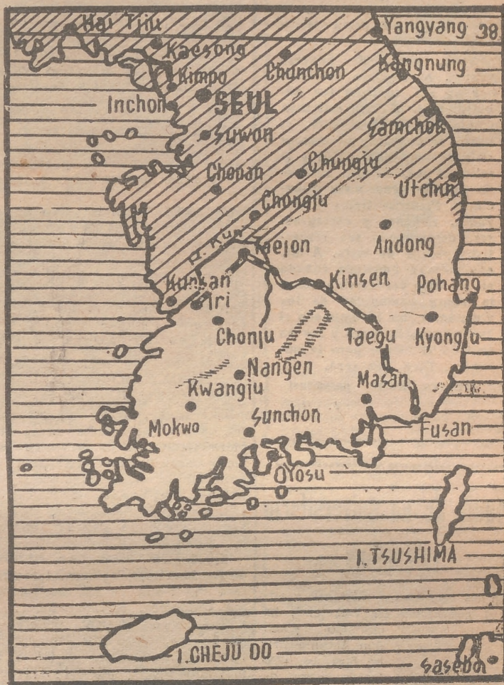
Estado actual del frente

Tokio, 20.— El comunicado de aviación número 107, del cuartel ge-