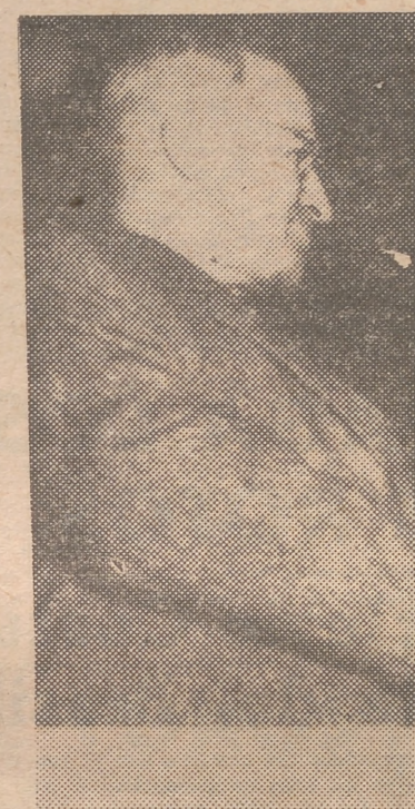
TRUMAN Otra vez en pie de guerra

Empieza Truman por hacer historia del conflicto coreano, en cuya exposición, por cierto, procura presentar la agresión de los comunistas coreanos a la O. N. U., cuando lo cierto, es que se trata de un reto directo a los propios Estados Unidos. La prueba está en que son éstos quienes, desde el primer momento, adoptaron medidas que después endosó la Organización Internacional, y que hasta ahora, casi todas las demás naciones, miembros de la O. N. U., se han excusado de enviar tropas o cuanto más, ofrecen alguna ambulancia completa de la Cruz Roja. Si Corea del Sur no hubiera recibido más ayuda que la moral de la O. N. U., a estas horas, los comunistas estarían en Fusan.