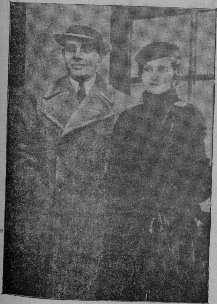
El príncipe Alexis Mdivani, que pereció en un accidente automovilista en Gerona. En la fotografía está acompañado de la que fué su esposa la multimillonaria Bárbara Hutton, de la que estaba divorciado