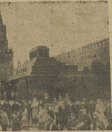
Lenin, cuya tumba, en Moscú, aparece en la foto, pidió en su testamento político que Stalin fuera sustituido en la secretaría general del partido por su grosor y por sus desmedidas ambiciones políticas.

na y en Corea, y en relación con la repatriación de los prisioneros de guerra japoneses. En Europa, desde el comienzo de las hostilidades, en 1939, la Unión Soviética se había anexionado Lituania, Lituania, Estonia y una parte de Polonia, Euzemia Checoslovaquia y Finlandia; Gobiernos adictos al Kremlin tenían sujetos a Polonia, Bulgaria y Yugoslavia. Los comunistas que formaban parte de los Gobiernos de coalición de Checoslovaquia y en Hungría se mostraban cada vez más agresivos y petulantés y ha-