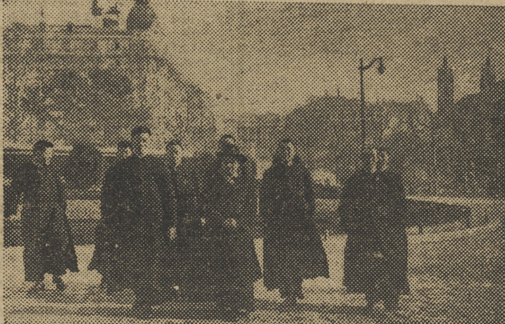
MADRID.—Seminaristas chinos de Honk-Kong llegados a la capital española, desde donde marcharán a Navarra para completar sus estudios