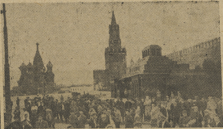
Lenin, cuya tumba, en Moscú, aparece en la foto, pidió en su testamento político que Stalin fuera sustituido en la secretaría general del partido por su grosor y por sus desmedidas ambiciones políticas.

Viéndole cara a cara, Stalin no es, en manera alguna, ese personaje antipático que han descrito ciertos autores. Lo cierto es que tiene cierto atractivo cuando le viene en gana ser amable. Aunque no es alto, sino más bien cuadrado, se mantiene er-