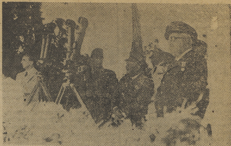
SAN SEBASTIAN.—S. E. el Jefe del Estado, con los altos jefes del Ejército español, durante el ejercicio táctico desarrollado en las Peñas de Haya.