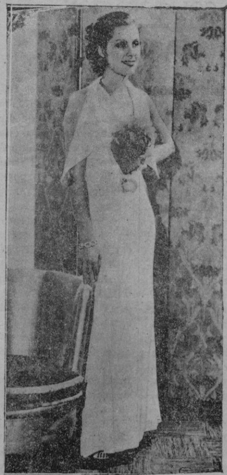
La moda. — Elegante y distinguido traje de etiqueta, de crespón blanco prensado, lucido por Irene Harvey, artista de la Metro-Goldwyn-Mayer. Las flores son de seda amarilla en tonos oscuros y claros, sobre hojas verdes