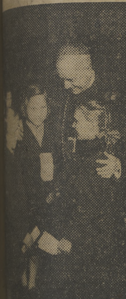
El obispo de Madrid-Alcalá recibe a las niñas austriacas, que recientemente han llegado a la capital de España.

Londres para el programa del Pacto del Atlántico