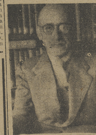
D. JACINTO BENAVENTE

El insigne comediógrafo don Jacinto Benavente prepara un viaje a Méjico, que llevará a ca-