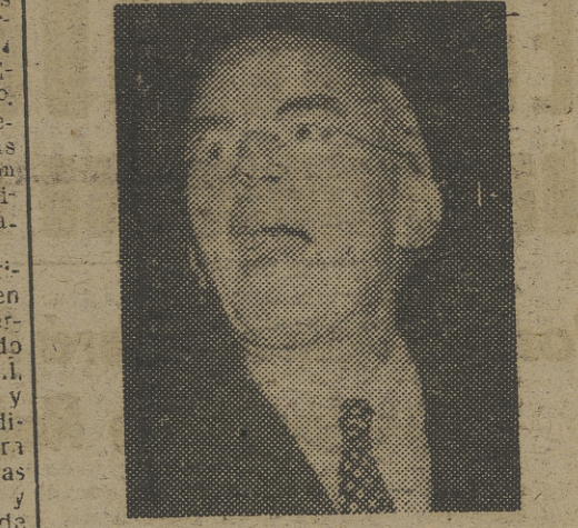
CRIPPS Sir Austerity y Canciller de Hierro

Ante la desesperada situación con que se enfrentaba Inglaterra al acabar la guerra, Cripps, con un criterio económico rigurosamente ortodoxo, aplicó los clásicos remedios de disminuir los gastos y aumentar la producción. Al disminuir los gastos, bajó el tipo de vida británico, a tal punto, que sir Stafford mereció el sobrenombre de «Sir Austerity», y otros llegaron a decir que la palabra austeridad, encubría la real de pobreza. Al aumentar la producción y dedicar su mejor parte a la exportación, disminuyó, a