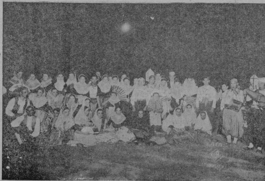
Grupos de "Payeses" que bailaron y dieron brillantez a la velada de las fiestas Patronales de Binisaïem.