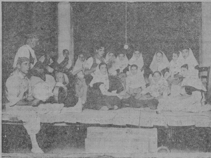
Fiestas Patronales de Binisaïem. — Grupo de "Vermadors" de Binisaïem. Al compás de sus sonos y cantos, bailaban las parejas en la plaza mayor adornada artísticamente en la velada de ayer.

Quedaron despachados para Valencia el vapor correo "Mallorca"; para Barcelona los pailebotes "Carmelita" y "Cala Contesa" con carga general; para Valencia el pailebot "Cala Llamp" con efectos; para Adra y escalas el pailebot "Cala Bona" con abonos; para Mahón el pailebot "Flor del Mar" con carga varia; para Ibiza la balandra "Rafael Verdera" con efectos; para Barcelona el tanque "Camprodón" con lastre.