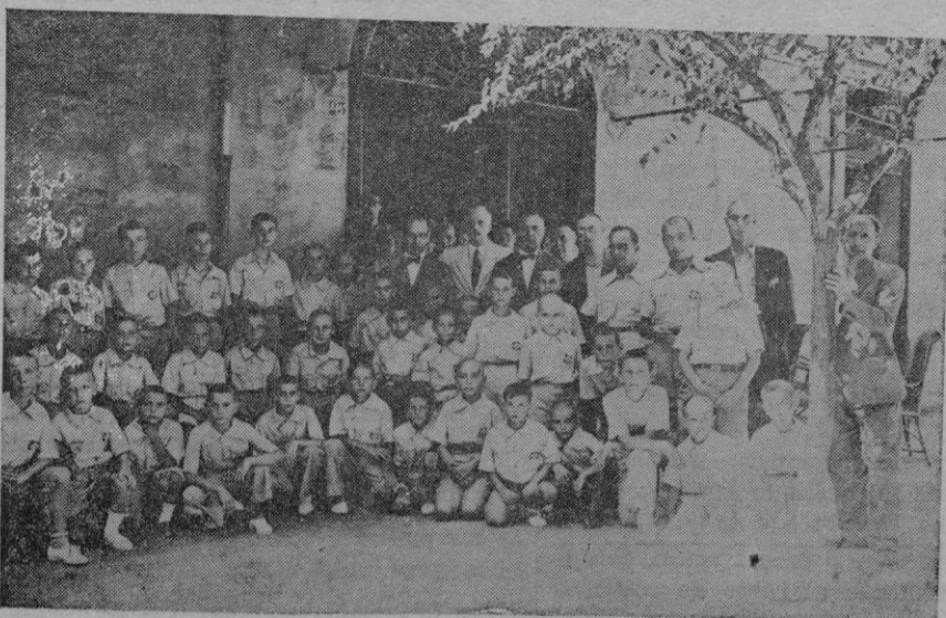
La Colonia Escolar de la Acción Popular Agraria, que salió para Lluç

Hasta ahora, es cierto, había muchos que se encargaban, sin título alguno, de interpretar y llevar a la práctica el proyecto del Arquitecto; pero otro señor, Arquitecto también, nos ha dicho que temía ver derrumbarse el día menos pensado un sin-