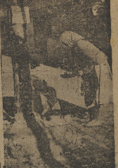
Junto al edificio de la Dirección General de Loterías ya figuran los primeros puestos para presen- ciar el Sorteo de Navidad. Este matrimonio, con su hijo de po- cos meses, ha copado los pri- meros puestos.

Aparte del ascenso a cinco se- ries que supone los 75 millones de primer premio, pero que si- gue manteniendo la cuantía de 15 millones por serie en el Gor- do, el sorteo de Navidad, de es- te año, cambia algo respecto a los anteriores. Los seis primeros premios de 15 millones, seis millones, tres millones, un millón, medio mil- llón y 250.000 pesetas, permane- cen inalterables. En lugar de dos premios de 150.000 pesetas que hubo el pasado año, éste sólo habrá un premio de dicha cuantía. En lugar de los cuatro premios de 100.000 pesetas tra- dicionales, este año sólo habrá dos y en lugar de los once pre- mios de 75.000 pesetas, este año sólo habrá tres. Los diez y dos premios de 50.000 quedan redu- cidos ahora a cinco y los veint-