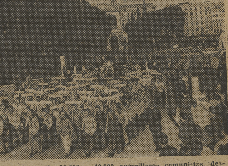
Al frente de 30.000 o 40.000 guerrilleros comunistas, desfiló por los arrabales de Roma, hasta donde la policía lo permitió, el llamado coronel Valerio, asesino de Mussolini, en Dongo, que se ve a la derecha de la foto. — En la segunda, un aspecto de los manifestantes