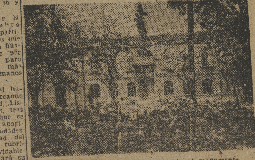
Un momento del acto de ayer ante el monumento a Cervantes.

Ayer se inició la Semana Cer- vantina, con la que se rán clausu- rados los actos celebrados con motivo del centenario de Cervan- tes. El día de ayer fue el esco- gido por la Enseñanza Primaria para dedicar su homenaje a la memoria del inmortal autor. A las once de la mañana, re- presentaciones de obras de todos las escuelas nacionales de Va- lencia, acompañados de sus maes- tros, desfilaron ante el monumen- to a Cervantes y a Don Quijote, erigido en la ciudad, depositando flores como ofrenda, mientras que la Banda Municipal interpretaba adecuadas composiciones. A las seis, en el salón del Conserva- torio de Música, tuvo lugar un so- lemne acto, ofrecido al Prin- cipe de los ingenios Españoles por la Escuela Superior del Magis- terio. Esta tarde, a las siete y me- dia, hablará en el Paraninfo el doctor Orozco Daz, sobre el te- ma: «Una introducción al Per- tino y a la inmortalidad del alma de Cervantes». En dicho acto se hará público el fallo del jurado que ha calificado el concurso escolar de la Enseñanza Media, cuyo pre- mio será entregado solemnemen- te al agraciado.