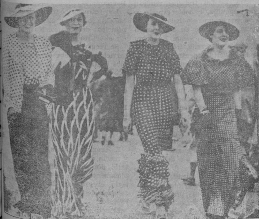
Las elegantes luciendo las últimas palabras de la moda en el hipódromo de Ascot (Inglaterra)