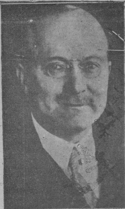
M. André Citroën, el famoso industrial, creador de la conocida marca de automóviles, que ha fallecido en una clínica de París, después de haber sufrido una delicada intervención quirúrgica

—Soy viajante de comercio y es la primera vez que vengo a esta población. ¿Podría usted indicarme algún hotel? —¿Un hotel? —Sí; uno que no sea el mejor, pero que sea bueno. —Creo que el de Las Cuatro Coronas... —¿Está lejos? —Tiene usted que seguir esta avenida, torcer luego por la segunda calle a la derecha..., no, la tercera..., luego, la primera a la izquierda..., no, a la derecha.