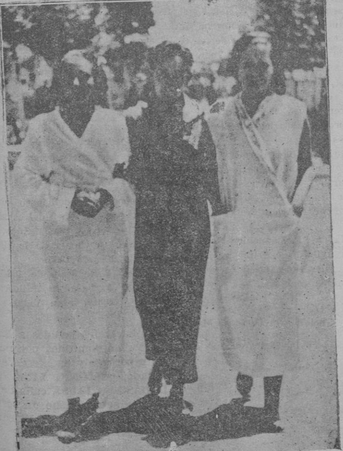
El uso del albornoz. — Aspecto de una de las playas de Madrid, después de las disposiciones del Director General de Seguridad