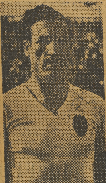
Que ayer debutó, con éxito, en las filas del Valencia

este tuvo mejores alicientes que los habituales de «guante blanco» y si hubo rivalidad y pasión, fué más en las gradas que en el césped.