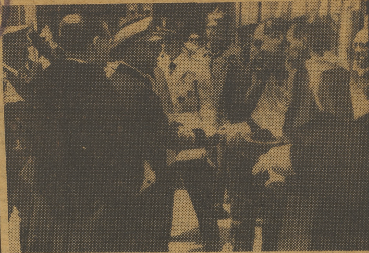
BARCELONA.—S. E. el Jefe del Estado, a su llegada a la Universidad, saluda al claustro de profesores.