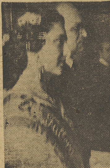
El ministro de Educación Nacional recibe, en su despacho, la visita de la fallera mayor y señoritas de la corte de honor, que la acompañaban