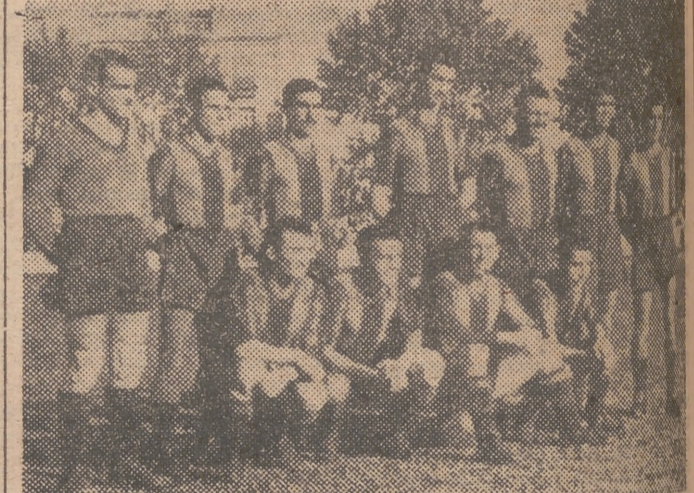
venció al grupo de Villagrasa por 3-2, en Zaragoza.

En este caso, ascenderían, pues, Málaga y Arenas. Si es que los malagueños no perdían en su camino frente al Valladolid, con lo cual la cosa habría de resolverse por el gol averaje general, ya que existiría un triple empate para el segundo puesto, entre levantinos, vallisoletanos y areneros.