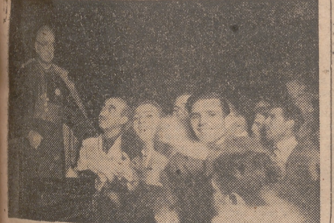
La muchedumbre, rodeando el coche que conducía al ilustre Prelado, aclama con entusiasmo al excelentísimo y reverendísimo doctor don Marcelino Olaechea