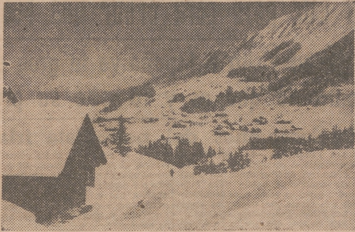
Quizá en este paisaje de «Rizlern», en los Alpes alemanes, se escondan los miembros del «maquis» alemán, que no se su patria después de haber perdido la guerra.

El primer ministro de Baviera, doctor Wilhelm Hoegner, es pródigo en declaraciones interesantes, como éstas que acaba de hacer al corresponsal en Munich de la revista londinense «The Observer»: