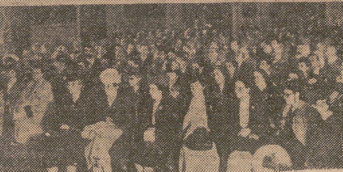
Dos momentos del solemne acto que se ha celebrado esta mañana en el Palacio de la Generalidad, con motivo de la inauguración de las tareas del Congreso Hispano-Portugués de Dermatología. — (Fotos Finezas. — Información en la segunda página)