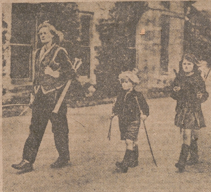
La famosa novelista inglesa, autora de «Rebeca» y otras obras llevadas al cine, se dirige, con sus dos hijos, a practicar el deporte del arco. Daphne Du Maurier está casada con el mayor general Browning. Su último libro es «El general del rey», todavía no aparecido y que se refiere a la época de Cromwell.