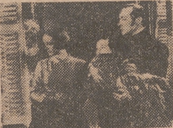
Cinta aparte de otros valores descañan en la magnífica labor de estos dos grandes artistas.

Sería difícil destacar a uno de ellos en la labor de conjunto. Si Bette Davis se ofrece como la mejor actriz cinematográfica capaz de empresas de la envergadura interpretativa que exhibe en «El cielo y tú», en su difícil personaje de Henriette, Charles Boyer se ha enfrentado con un personaje macizo, afortunadamente interiormente por la enfermedad cecosa de una mujer de complicada psicología. Y ambos consiguen un triunfo completo. Toda la