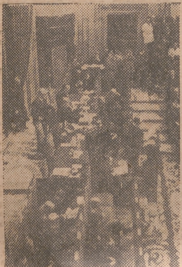
Una vista del salón de sesiones de las Cortes Españolas, durante la ceremonia de la jura de los nuevos Procuradores.

“Aquí se armoniza la libertad con la igualdad, sin atentar contra la unidad religiosa, social y del Estado”