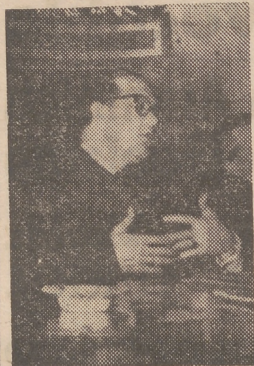
El gobernador civil durante las palabras que pronunció en la asamblea naranjera

Al objeto de tratar de la solución del problema naranjero planteado por la reciente nevada y que