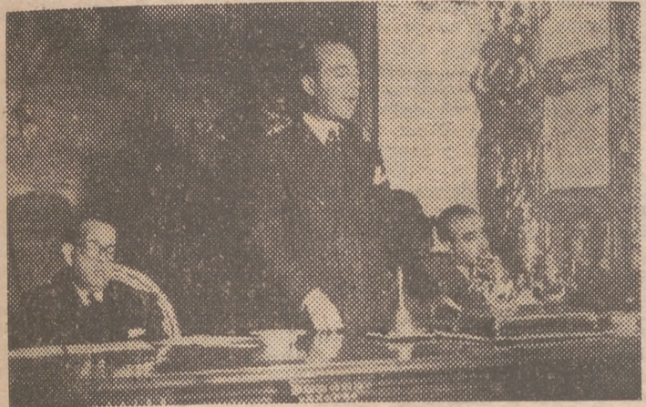
Un momento de la asamblea de la Feria Muestrario