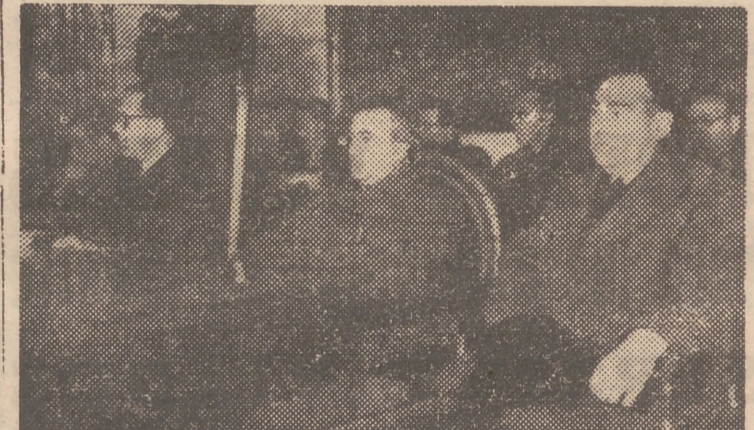
Los gobernadores de Castellón y Valencia, en la asamblea naranjera de ayer.

A últimas horas de la tarde esta ponencia tuvo un cambio de impresiones con el director general de Comercio y con el secretario técnico del Ministerio de Agricultura, señor Bornás, quien, por designación del ministro del ramo, llegó ayer para interesarse también por la pronta solución del problema que hoy agobia a los productores de naranja.