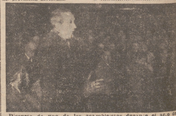
Discurso de uno de los asambleístas durante el acto de ayer en el Ayuntamiento

Se estrenó en el Principal la opereta «El soldado de chocolate» en Apolo, estreno de la comedia «Una aventura en París»; en Elava, estreno de la comedia escrita en italiano, traducida al español, titulada «Como las hojas», y en Olympia la comedia de Manuel Seca, «No te ofendas, Beatriz».