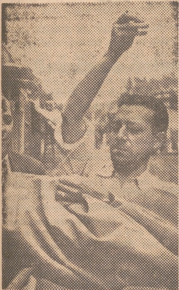
El vendaval tiró abajo los toldos de muchos barracones. En la foto aparece el encargado de uno de ellos zurciendo la lona con una habilidad que ya la quisieran para sí muchas amas de casa

todo trabajador deberá dirigirse a la Delegación del Instituto Nacional de Previsión respectiva, expresando con claridad los meses no cobrados, el nombre de la empresa, su número patronal y el que le correspondió como subsidiado a más del nombre y dos apellidos del reclamante. Rápidamente recibiréis la información adecuada.