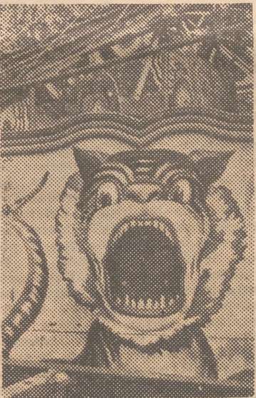
Este gigantesco felino abre sus fauces dispuesto a tragarse todas las perras que chicos y grandes lleven a la Feria

El vendaval de anteayer derribó gran número de tinglados ya en término de montaje, pero no importó. En la hora inaugural, la Feria de Navidad, en su total conjunto, se mostrará flamante y bullidora, con esa su alegría de