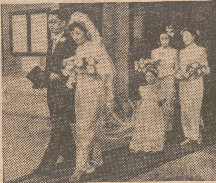
En la iglesia de San Martín, en Trafalgar Square, se ha celebrado la boda de la vicecónsul de China —única mujer del cuerpo diplomático acreditado en Londres— con un compatriota suyo. Las damas de honor también eran de aquella nacionalidad