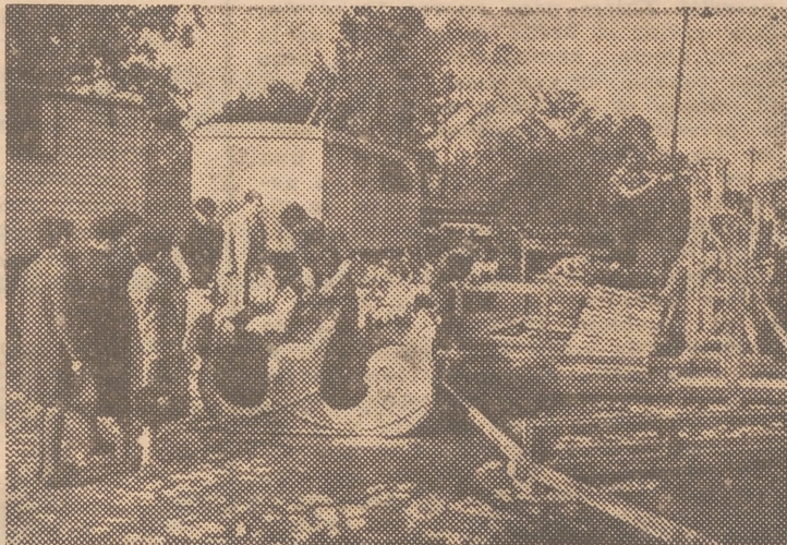
Un grupo de chiquillos, impacientes ya por divertirse, siguen con interés el montaje de uno de los carrouseles

La Feria de Navidad posee un encanto verdaderamente infantil. Es la que podríamos llamar feria de los niños, puesto que casi todo cuanto figura en ella es por y para su complacencia y recreo. La Feria de Navidad suele durar unos cuarenta días y algunos más, como ocurrió en el anterior. Durante su celebración concurren al ámbito ferial, durante la mañana y tardes de sol, en días festivos y domingos, no solamente los niños sino que también los mayores. La Feria navideña posee un irresistible atractivo y su ambiente un poder de sugestión que obra, especialmente, sobre la masa popular. No se conciben las Navidades sin la celebración de la tradicional feria.