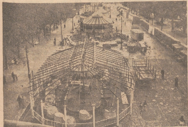
Una vista aérea del «esqueleto» de la Feria de Navidad, obtenida desde lo alto del tobogán.

celebró en la plaza de San Francisco, comprendida en el área que ocupa hoy la plaza del Caudillo. Por el año 1870, ocupó una zona que abarcaba los solares del convento de San Cristóbal, situado mediada la hoy calle de la Paz; en 1885, ocupó un sector entre la Glorieta y el Parterre; por los años de 1889, se celebró en la que fué plaza de la Aduana y en la Glorieta; en el año 1895 fué instalada la Feria de Navidad, de nuevo, en la plaza de San Francisco; allá por el año 1906, volvió a ocupar la Glorieta, la plaza de la Aduana y el Llano del Remedio; en 1909 tuvo lugar en los solares de lo que fué barrio de Pescadores; en 1912, vuelve por tercera vez a la plaza de San Francisco; en 1913 fué instalada en la Gran Vía; en 1918 ocupó