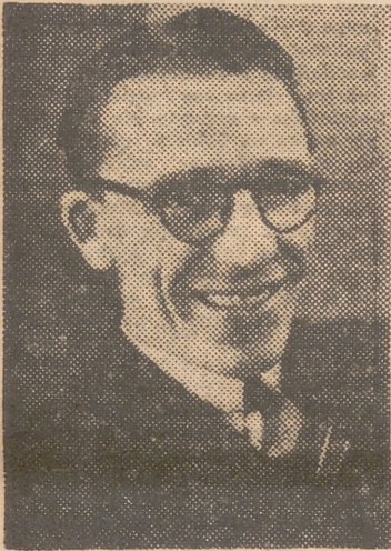
Un primer plano de Francisco Martínez Soria

—¿El señor Martínez Soria...? —Por favor, espere un momento —me contestó el portero del teatro Alkazar—. Voy a avisarle. Y tras una brevísima pausa, oigo al otro extremo del hilo telefónico la voz llena de cordialidad y simpatía de este destacado artista teatral y cinematográfico que hoy ocupa, por derecho propio, un lugar preeminente entre