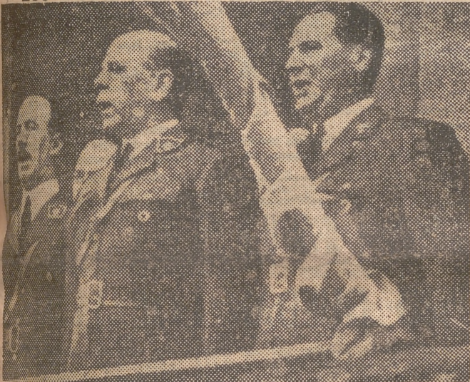
El presidente Farrell y el coronel Perón (a la derecha), dirigiéndose a la multitud, durante los recientes sucesos de la Argentina