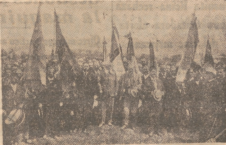
Las banderas de los somatenes, reunidos en la revista del Bruch, en 1908

Fué el general Primo de Rivera quien, por primera vez extiende la institución del somaten a toda España. Ya en su manifiesto del 13 de sep-