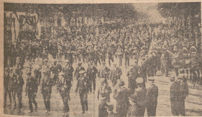
Desfile del somatén de Barcelona en 1921

En efecto, días después era publicado ese decreto, por el que la antigua institución catalana adquiría carácter nacional. La República, después