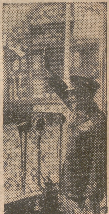
El general norteamericano saluda a la muchedumbre que le aclamó durante su visita a la ciudad de Nottingham.