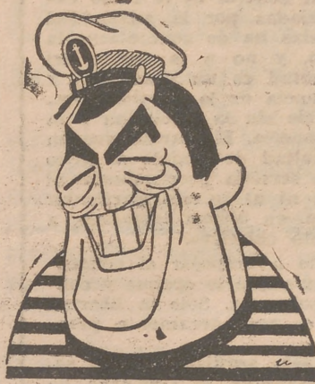
Victor Mc. Langlen en «Al sur de Pago-Pago»

Las aventuras de los buscadores de perlas, primeramente enfocadas