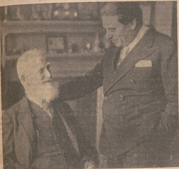
El ilustre escritor George Bernard Shaw, hablando con un periodista en su residencia de Londres.

¿Qué nos deparará la comedia que ahora escribe el dramaturgo irlandés? El había ya clasificado también a los pueblos en agradables —si eran vivos y se incorporaban a la vida mundial— o desagradables, si su estulticia les impedía hacerse presentes en la grande Historia. Tenemos que ahora el siempre joven irlandés ciudadano del Imperio, rubrique su testamento literario afirmando que los pueblos que él llama desagradables son, al fin y a la postre, los que han encontrado el camino de la felicidad.—Cifra.