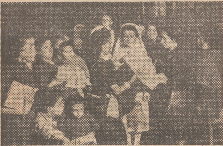
Instantánea obtenida ayer en el acto que, para festejar el Día del Caudillo, organizó la Sección Femenina. En este acto, correspondiente al ciclo de la campaña contra la mortalidad infantil, se procedió a la entrega de castillas a las madres pobres.