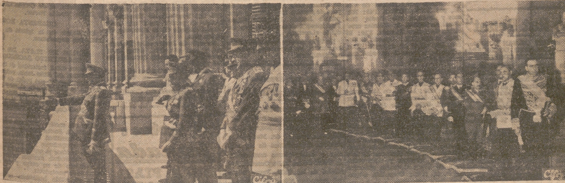
1.—Franco saluda a los muchachos del Frente de Juventudes, que le aclamaron con entusiasmo. — 2.—El Gobierno español, en pleno, en el solemne Te Deum celebrado en San Francisco el Grande. — (Fotos: Cifra)

El Día del Caudillo, en la capital de España