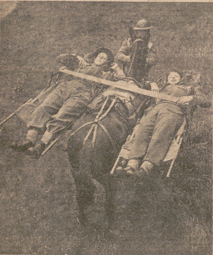
Dos soldados «heridos» son llevados en un mulo durante unas recientes maniobras de tropas inglesas de montaña