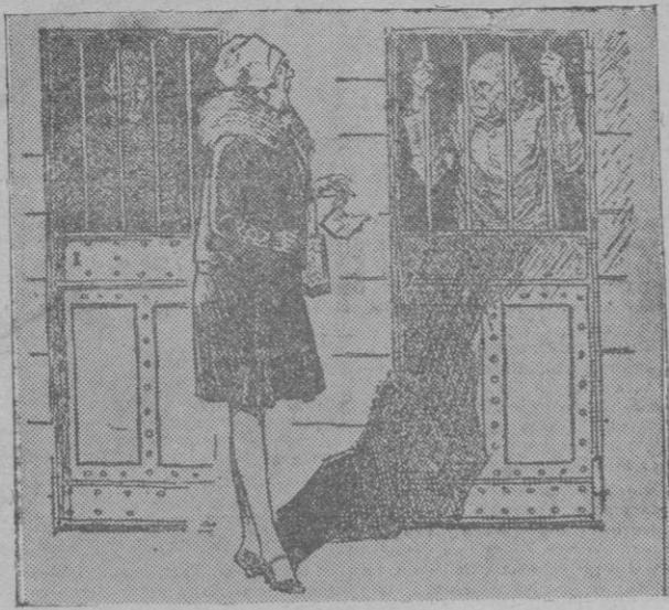
La señora caritativa que visita a los presos. — ¿Puedo hacer algo para alegrar su vida. — Sí, señora. Si se pone usted a bailar un "one step", mi compañero y yo nos retiramos mucho.

traje histórico vale en arriendo 10 dólares semanales; 20 un mueble de valor, y 50 un carruaje.