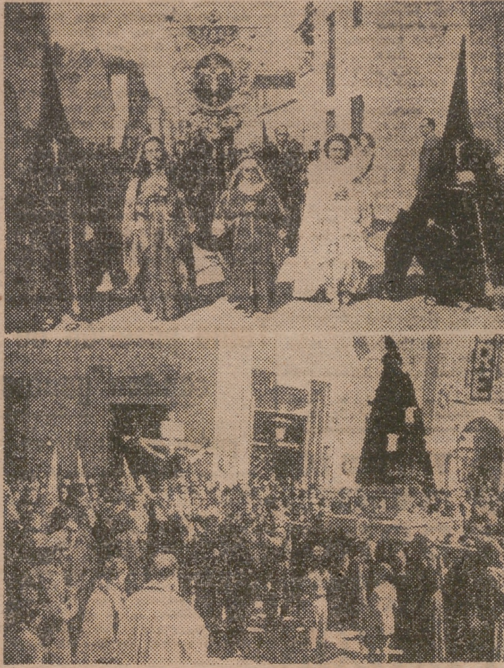
Dos aspectos de los solemnnes y tradicionales actos religiosos que, con motivo de la Semana Santa, se han efectuado estos días en los poblados marítimos de Valencia

Se invita a todos los feligreses de la parroquia, especialmente a las cuatro Ramas de Acción Católica, y se suplica pongan colgadas en los balcones al paso de Jesús Sacramentado.