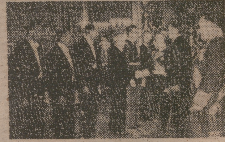
El Caudillo estrecha la mano de los agregados norteamericanos a la Embajada de los Estados Unidos, que le presenta el nuevo embajador, Mr. Norman Armour.