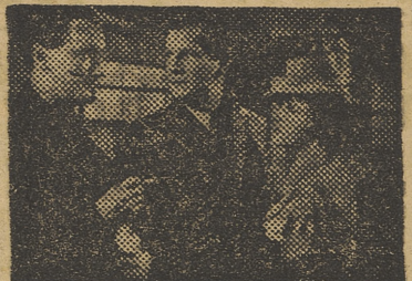
La trama, llevada con garbo y soltura, es muy rica en emociones, facetas sensacionales y episodios de gran espectáculo.

fondo, se han dado cita en las premisas, el desarrollo y las consecuencias del tema.