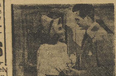
público, pero al que tiene distraído durante su proyección. Una comedia agradable, en fin, de las que el público busca es

Todo el encanto de las películas norteamericanas sin fondo ni profundidad, pero hábilmente llevadas y llenas de un humor constante, tiene este film ayer estrenado en Rialto con el título de «La Pitonisa». Película que no hace pensar al