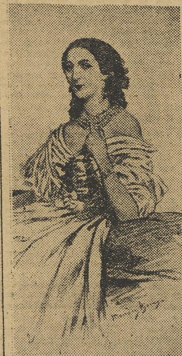
María Manuela Enriqueta Kirpatrick, condesa de Montijo, madre de la emperatriz Eugenia

El reinado de Josefa Amalia, que compartió el trono con Fernando VII, dió un nuevo