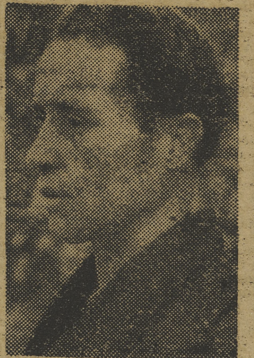
Que desde el domingo, a las seis de la tarde, posea el título nacional del peso mosca