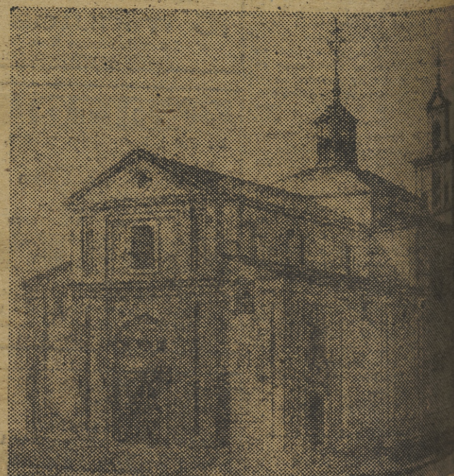
Vista del Santuario de la Gran Promesa, en Vallada, donde la Falange valenciana ha depositado el álbum con el nombre de los Caídos valencianos